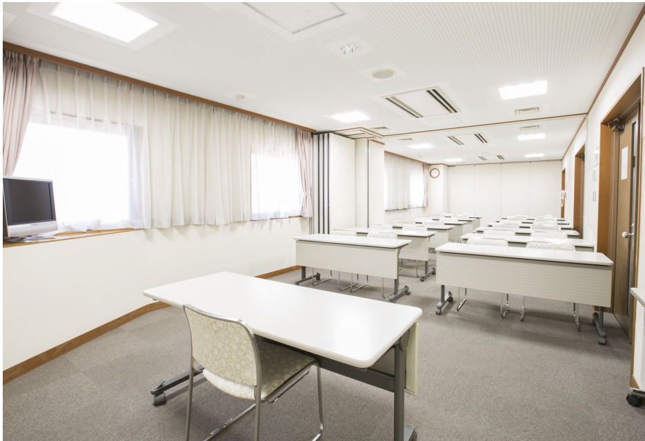
面積:50・60㎡ 天井高:2.5m・3.2m 【会場使用例】