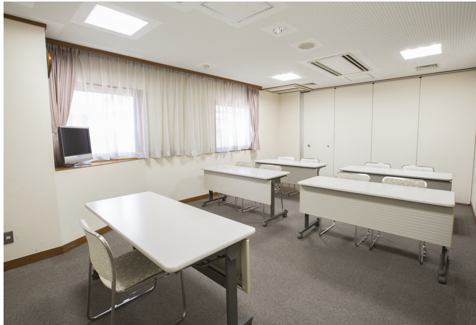
面積：25㎡ 天井高：2.4m 【会場使用例】