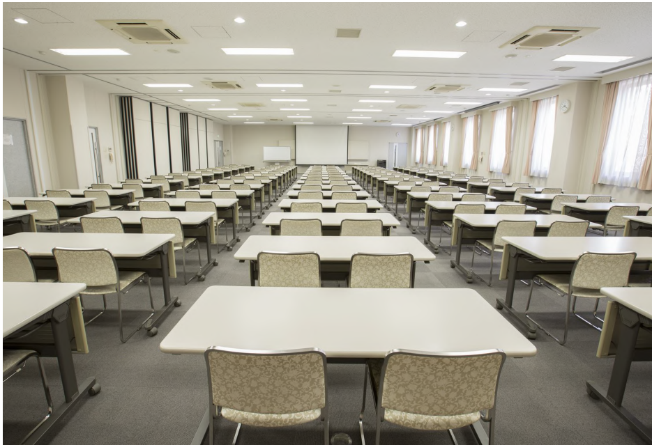
面積: 300㎡ 天井高: 3.2m 【会場使用例】