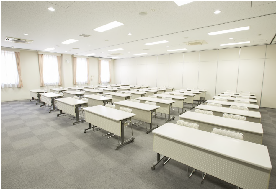
面積：135・140・160㎡ 天井高：3.2m 【会場使用例】