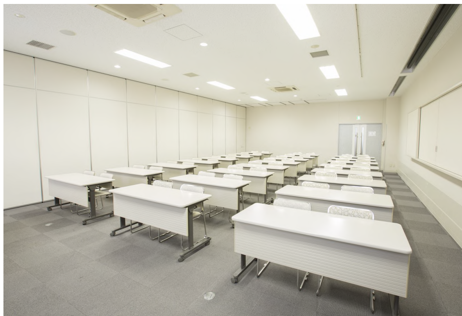
面積：90・100㎡ 天井高：3m・3.2m 【会場使用例】