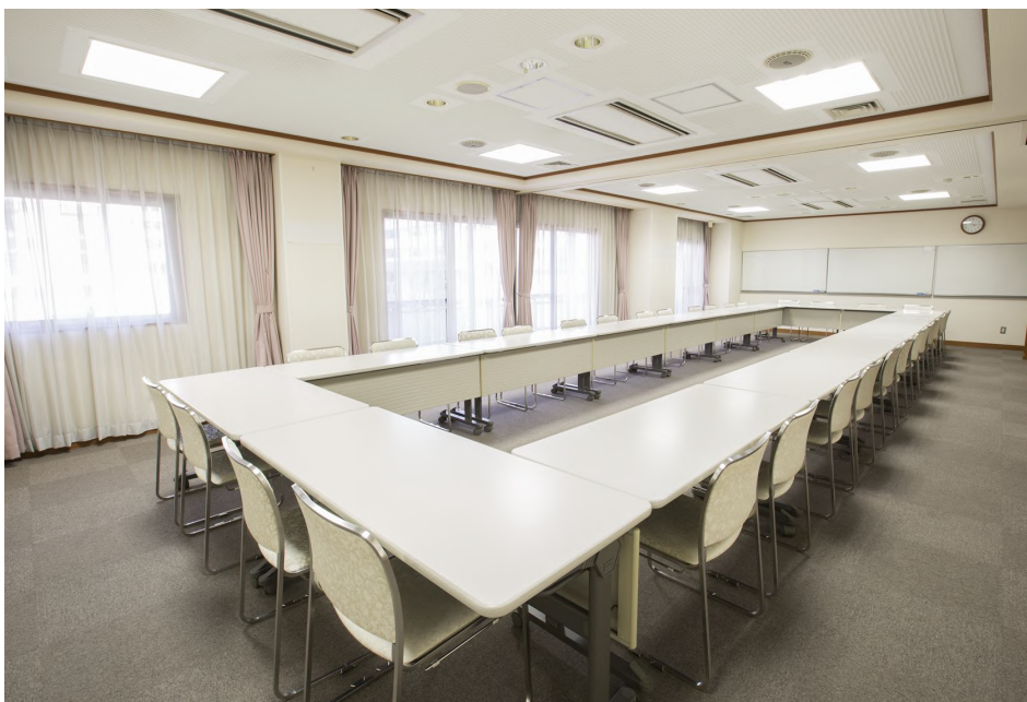
面積：70㎡ 天井高：2.5m 【会場使用例】