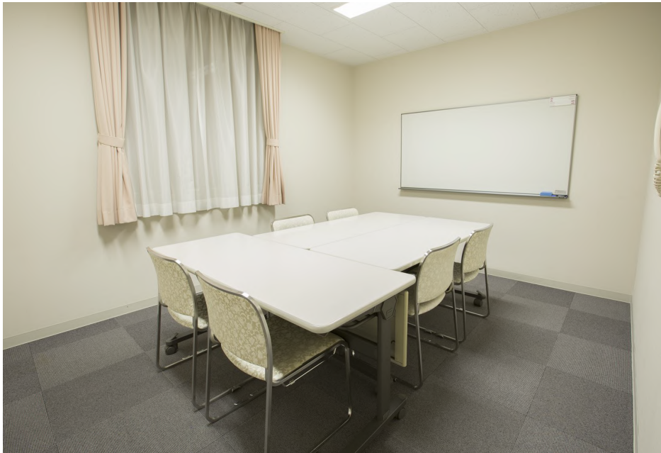
面積：10・15・20㎡ 天井高：2.5m 【会場使用例】